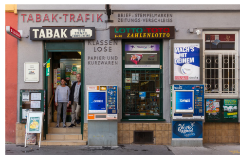
TABAKTRAFIKEN Die Fotoserie zeigt die Vielfalt dieser Verkaufsstellen und ihre Kunden sowie Besitzer in verschiedenen Bezirken Wiens.