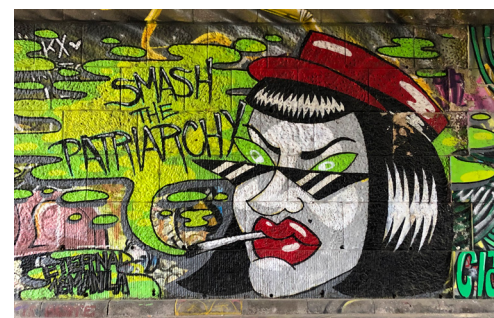
BERAUSCHTER DONAUKANAL Die Uferzone des Donaukanals ist schon seit vielen Jahren eine der wesentlichen Kulissen des Wiener Nachtlebens.