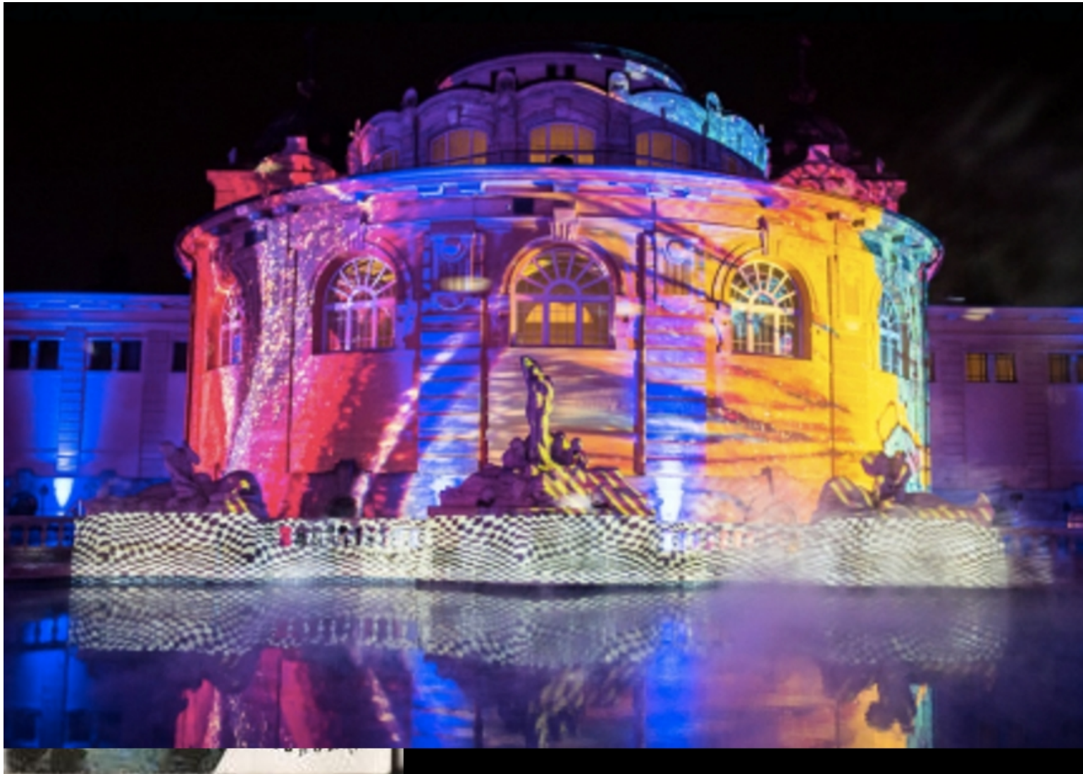
Abb. 29152-006 Bäder als Partyort