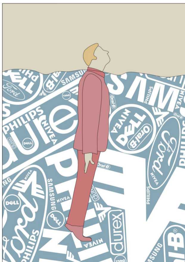
Es steht uns bis zum Hals