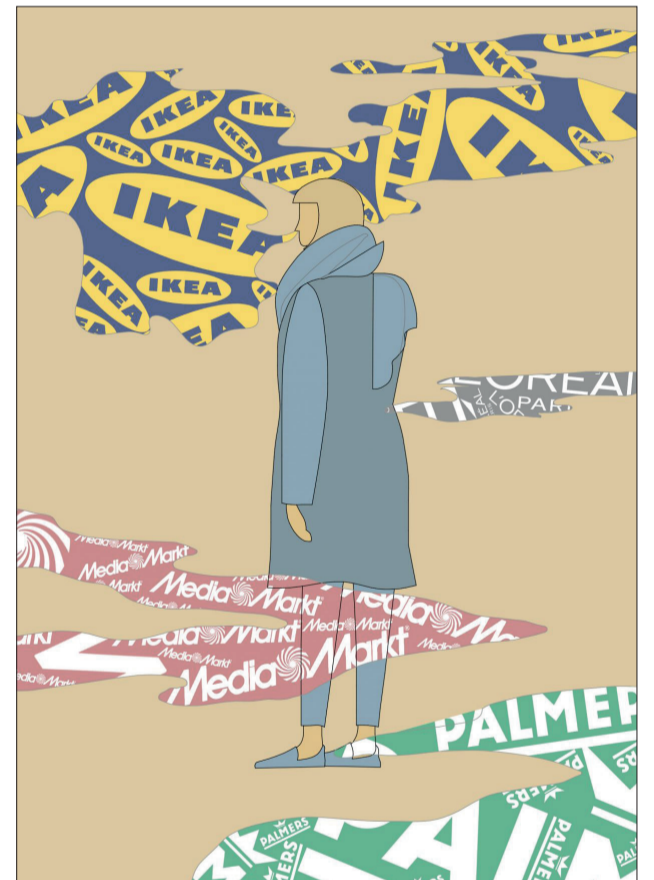
Verloren im Nebel