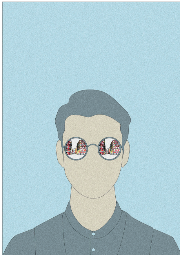
Lass dich nicht blenden